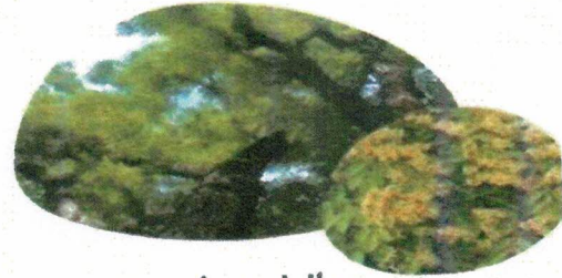
(ประจูป้า)