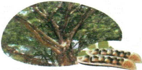
(มะค่าโมง)