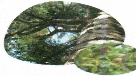
(มะฮอกกานี)