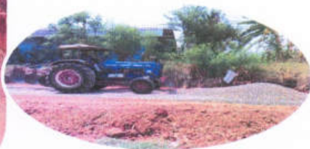
ปรับปรุงซ่อมแซมถนนเพื่อการเกษตร บ้านหนองบัวโคก - บ้านหนองกระโดน