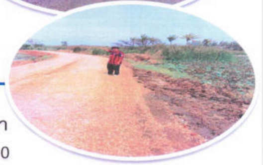
ปรับปรุงถนนลงหินคลุก บ้านแปรงใหม่พัฒนา ม.4 สายเรียบคลองโกรกม่วง ถึงบ้านหล่ง ม.10