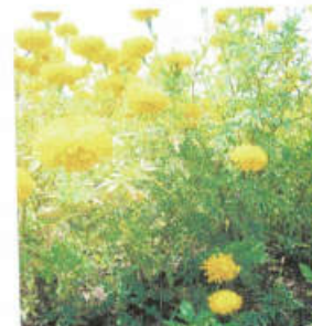
ผลผลิตดอกดาวเรืองที่ได้